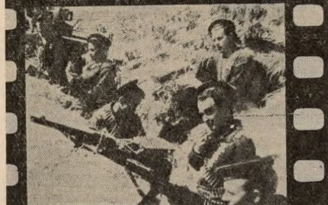
«Бітва за Кавказ»