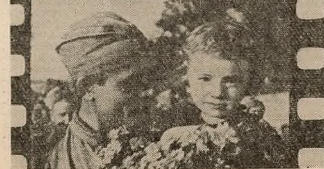
«Вялічайшае танкавое сражэнне»

Усё далей і далей ад нас падзеі Вялікай Айчыннай. Зараз ужо вырасла пакаленне людзей, якое нарадзілася пасля вайны і ведае аб ёй толькі па кнігах і кінафільмах, па расказах яе ўдзельнікаў. Суровыя дні барацьбы з фашызмам ужо сталі для нас, моладзі, гісторыяй. Таму кожны новы твор аб тым грозным часе выклікае асобую цікавасць.