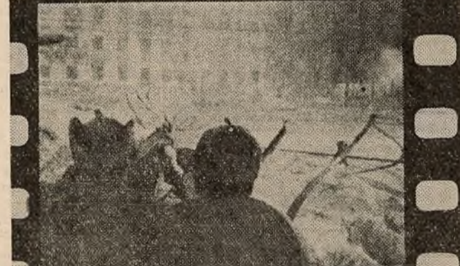
«Победа пад Сталінградом»