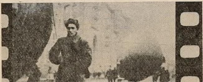
«Бітва за Маскву»